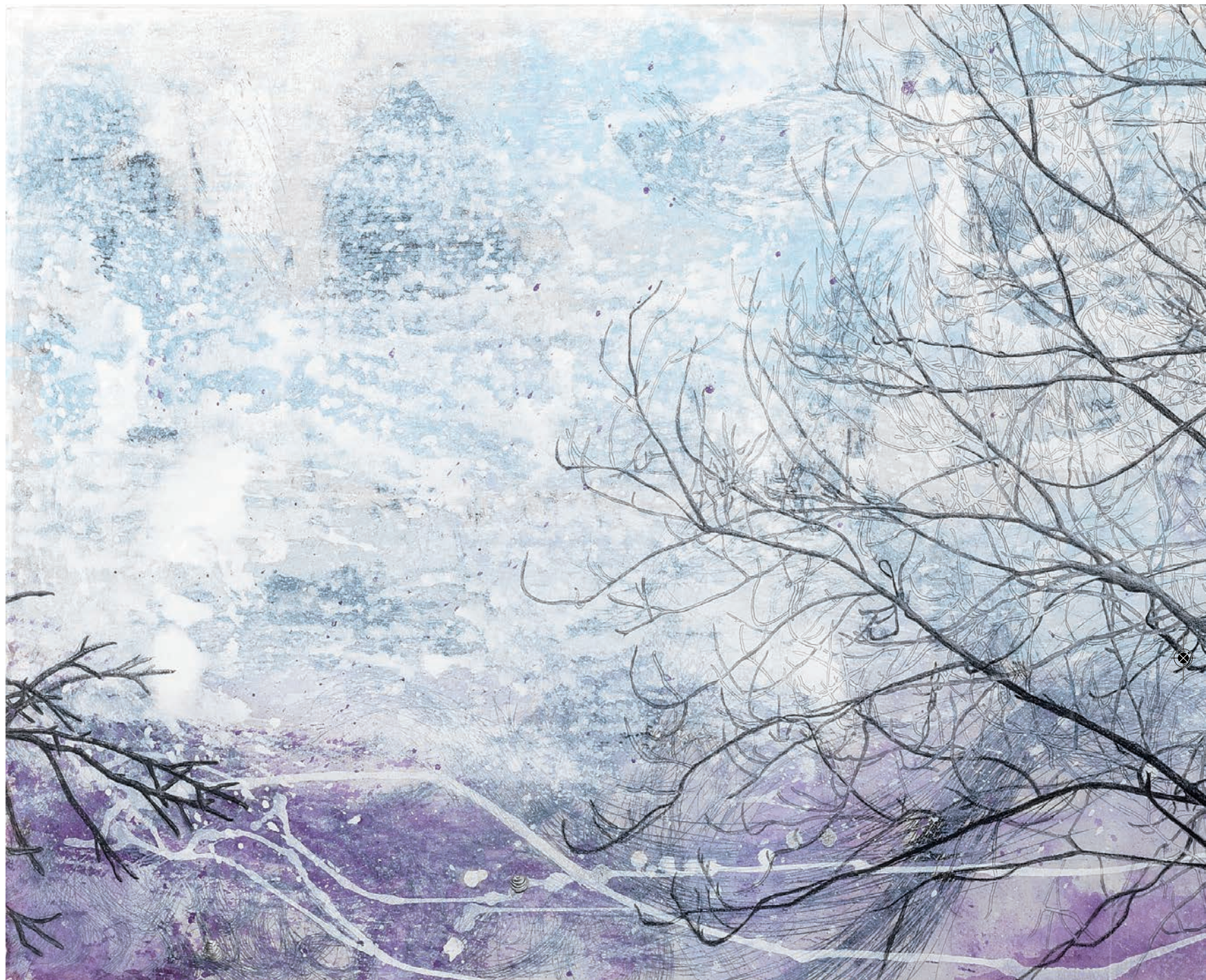
Uitzicht 2, 2013, tempera en potlood, 50 x 120 cm