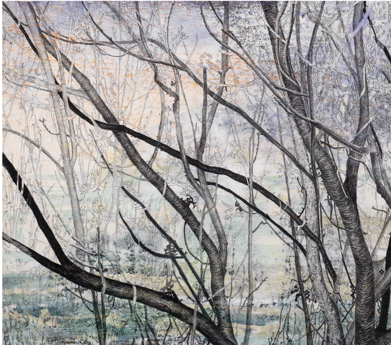
Doornburg 2, 2014, ets, tempera en potlood, 60 x 107 cm